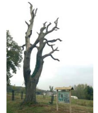
un châtaignier greffé mort