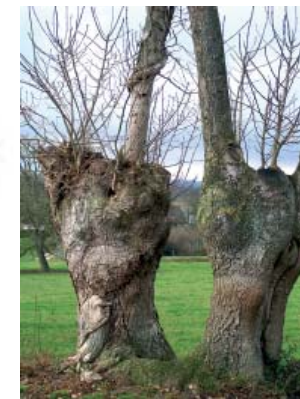
des arbres têtards