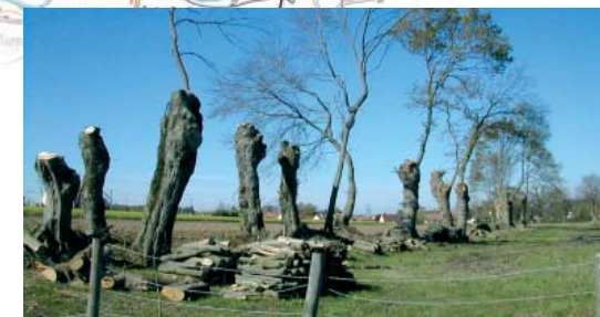
Exemple d'intervention qui n'affecte pas la vie des insectes : la mise en têtard (avec tire-sève)