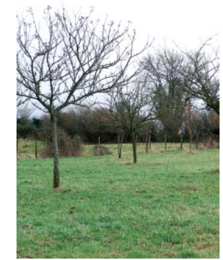
de jeunes pommiers à cidre