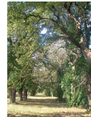
des châtaigniers greffés