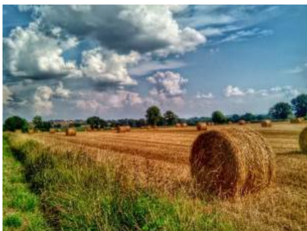
Feriosi72 – Instagram