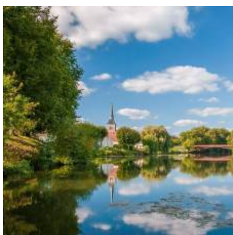
Arjuad – Instagram