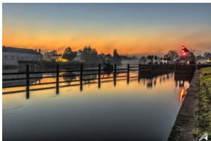
Phot'eau 85 – Facebook