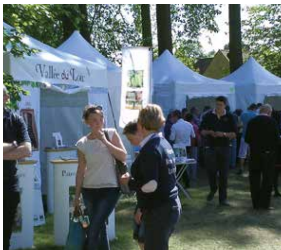
Salon des vins : Coteaux du Loir et Jasnières Abbaye de l'Épau 13 & 14 mai 2017

Cette nouvelle édition, organisée en association avec le groupement des viticulteurs de la Sarthe et le Département, est l'occasion unique de découvrir les nouveaux millésimes dans un cadre magnifique. De nombreux domaines seront représentés dans le village en extérieur accessible gratuitement et ouvert au public de 10h à 19h. On pourra également déguster des produits du terroir et dénicher de bonnes informations sur le tourisme en vallée du Loir.