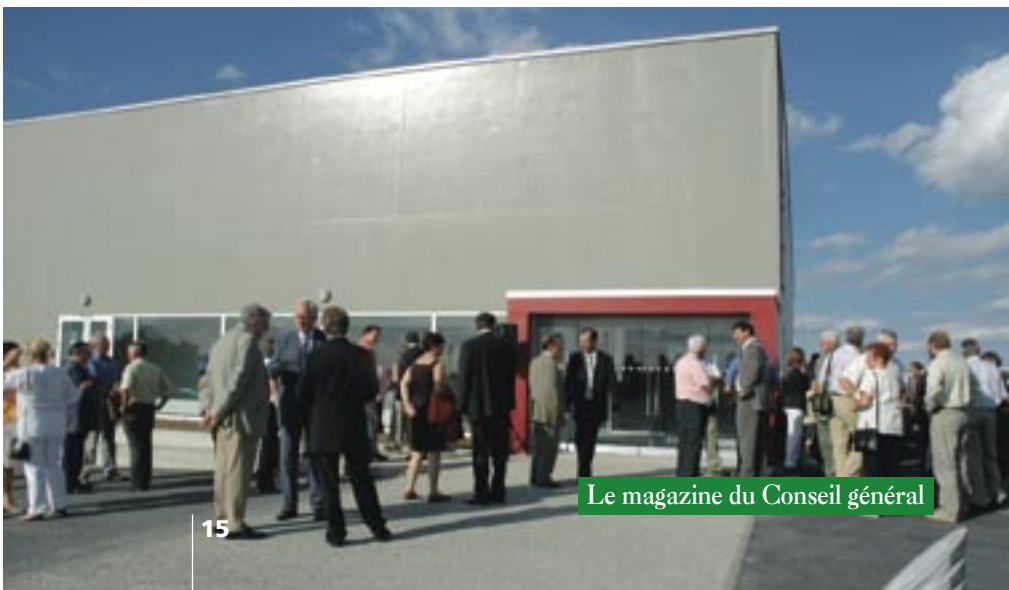
Le magazine du Conseil général